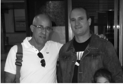
Terminal del bus de Santander en la salida hacia la ciudad de Salamanca.

p.m. Después paró en Aguilar del Campoo a las 6:20 p.m., la cuarta parada fue en Herrera de Pisuerga a las 6:45 p.m., la quinta parada en Palencia a las 7:50 p.m. Aquí cambió de autovía cogiendo rumbo a Valladolid donde llegó a las 8:30 p.m. Paró momentáneamente y dejó varios pasajeros, continuó rumbo a Salamanca donde por fin llegó a las 10:00 p.m.