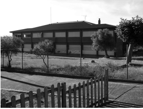
Nuevas escuelas fabricadas en el pueblo de Villarino de los Aires por la Junta en el año 2006.