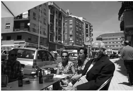
Foto tomada en la terraza de una cafetería de Salamanca.