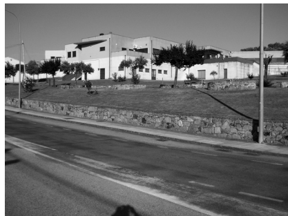
La residencia para los ancianos que no tienen ayuda familiar y viven en el pueblo de Villarino de los Aires.