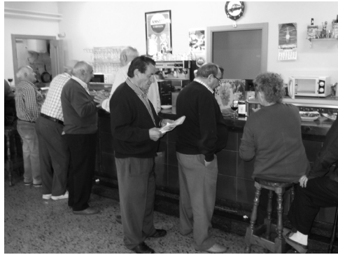
La cantina del Club de Jubilados donde se encuentran varios jubilados comiendo un pincho y tomando un trago.