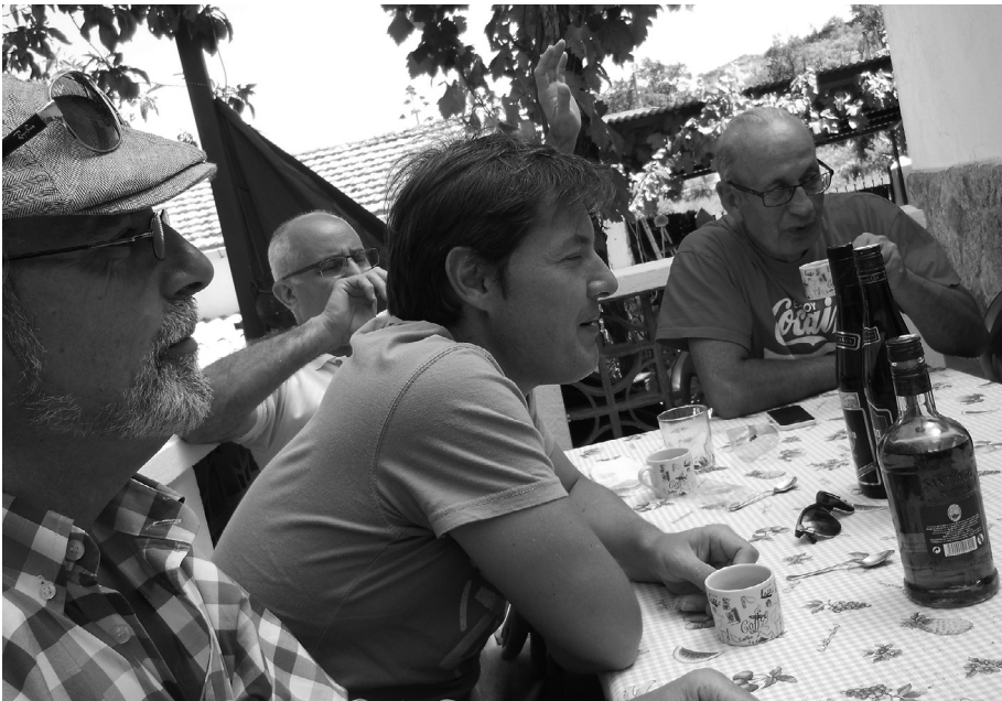
La familia completa almorzando; la comida exquisita.