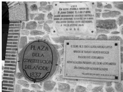
Placas conmemorativas en la fachada del Ayuntamiento de Villarino de los Aires.