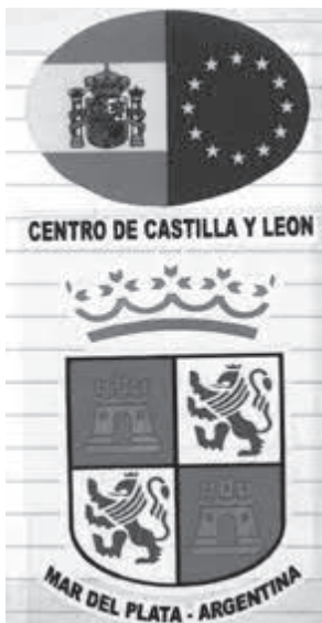
Adhesivos con los emblemas del Centro Castilla y León de Mar del Plata.