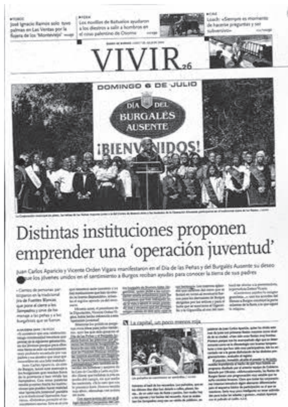
Noticia de prensa del Día del Burgalés Ausente.