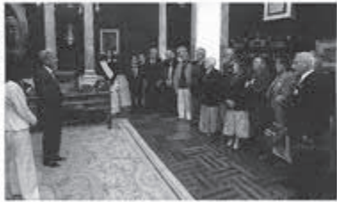
Recepción del estudio de Burgos y la comitiva de Santiago a los participantes en la Operación Afloranza 2003.

Los catorce participantes de la Operación Afloranza 2003 proceden de Argentina, Brasil, Chile y Uruguay y por sus respectivos países.