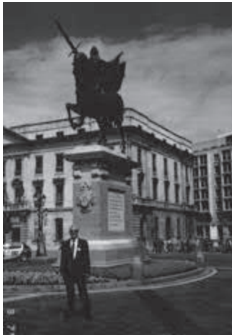
El autor del relato retratado bajo la estatua del Cid en Burgos.

Poema de agradecimiento por la invitación a la Operación Añoranza.