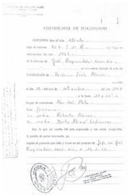
Certificado de nacimiento de Verónica Inés.

Soy un auténtico resultado de la emigración castellana y leonesa