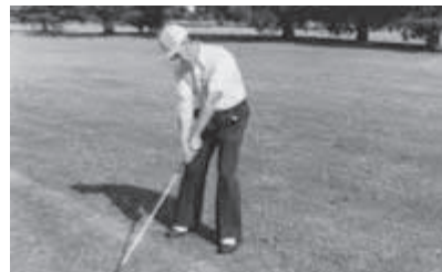
Tarjeta de la Asociación Argentina de Golf.