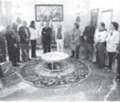
El presidente de la Diputación también saludó a los catorce integrantes de la expedición.