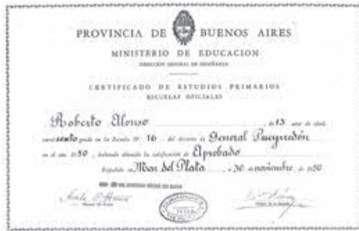
Certificado de estudios primarios del autor del relato.