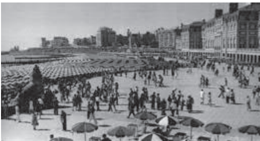
Mar del Plata. Paseo Marítimo, Casino y Gran Hotel Provincial. En él se celebró la reunión de Naciones Unidas.

Además estudié podología y decoración para dar ejemplo a mis hijos y demostrarles que cuando uno quiere puede. Así hicieron mis padres conmigo, si bien a otro nivel pero los resultados están: si uno siembra bien la cosecha es muy buena.