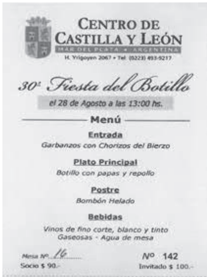
Tarjeta con el menú de la fiesta del botillo del Centro Castilla y León de Mar del Plata.