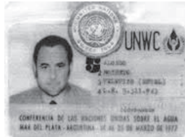
Tarjeta de identificación otorgada por Naciones Unidas en marzo de 1977.