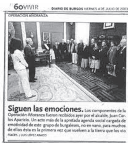
Noticias sobre la Operación Añoranza en los diarios de Burgos.