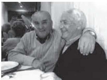
Esperando el botillo en el Centro de Castilla y León de Mar del Plata, con un lleno total.