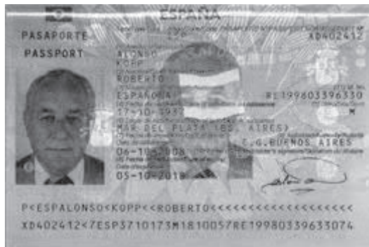
Pasaporte español del autor del relato.