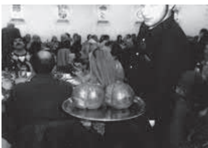
Así se sirve el botillo, buen provecho.