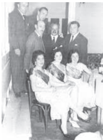
Año 1958. Reina y princesas del Centro Asturiano de Mar del Plata, con las autoridades de entonces.

Buenos Aires a rendir, y el día 14 de diciembre de 1953 obtengo el título definitivo del Curso Completo de Contabilidad. Estudié en la Academia General Belgrano de la calle Funes 2235 de Mar del Plata. Estaba incorporada a la escuela práctica de estudios comerciales Bartolomé Mitre de Buenos Aires, donde rendí con promedio de 8,50 puntos al obtener el título anteriormente mencionado. Este curso comprendía 12 materias a saber: contabilidad, teneduría de libros, derecho comercial, matemáticas, organización del comercio y de la empresa, caligrafía, gramática, economía, geografía, idioma extranjero (francés), taquigrafía y mecanografía.