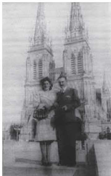
Luna de miel.