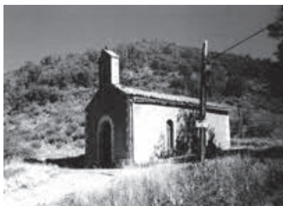
Ermita de San Roque, Garaño, León.