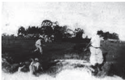
Trabajos de chacra y La yerra.