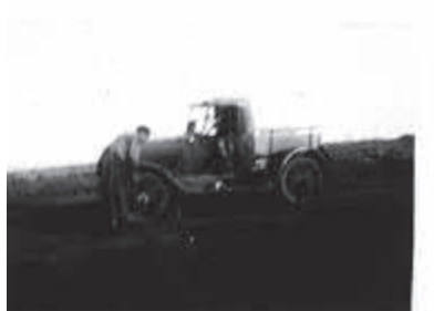
Un día en familia. Año 1932; Auto Chevrolet 38; Camioneta de la estancia.