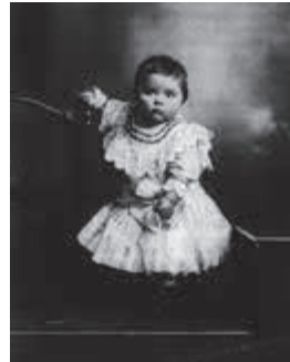
Vita a los dos años.