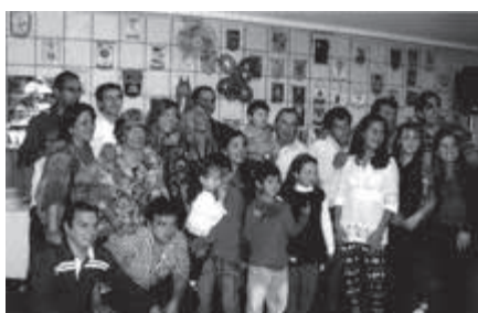
Nietos y tataranietos. Años 2011.