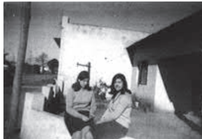
Casa en Lomauquén; Casa en Coronel Vidal.