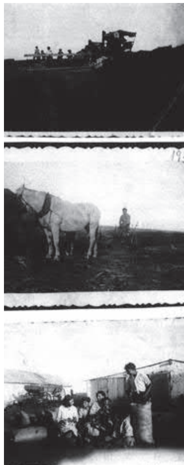
Trabajo de chacra.