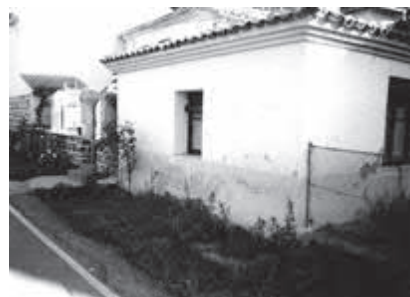
Casa familiar de Garaño