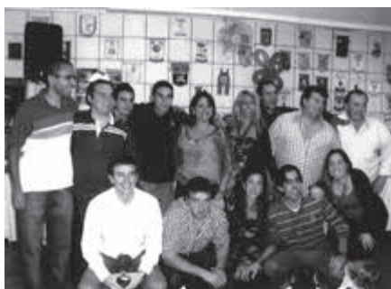
Los bisnietos. Años 2011.