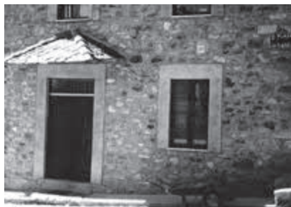
Casa familiar de Vega de Caballeros.