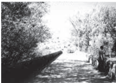
Vega de Caballeros, el río Luna.