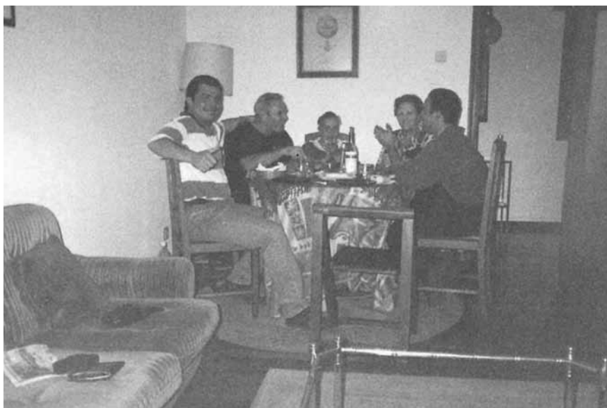
Santander, lunes 21 de junio de 1999. Celebración de mi 58 cumpleaños.