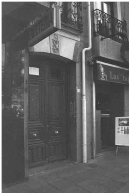
Madrid, miércoles 23 de junio de 1999. Edificio de la C/ Carranza nº 4, donde vivieron mi madre y todas sus hermanas.