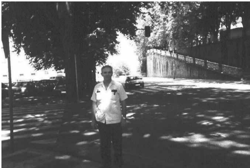
Pamplona, sábado 29 de mayo de 1999. Junto a la Plaza de toros de Pamplona.