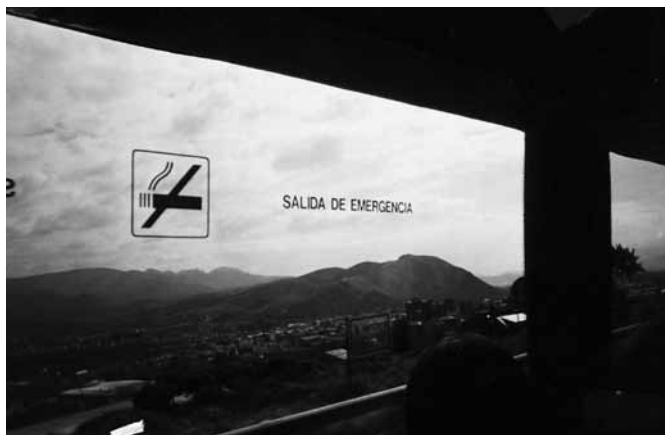
Ponferrada, 7 de junio de 1999. Fotografía a Ponferrada desde el autobús.