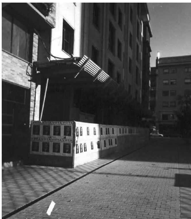
Ponferrada, martes 8 de junio de 1999. Edificio de nuestra casa en Ponferrada. Al fondo parada del autobús que nos llevaba a Lago Carucedo.