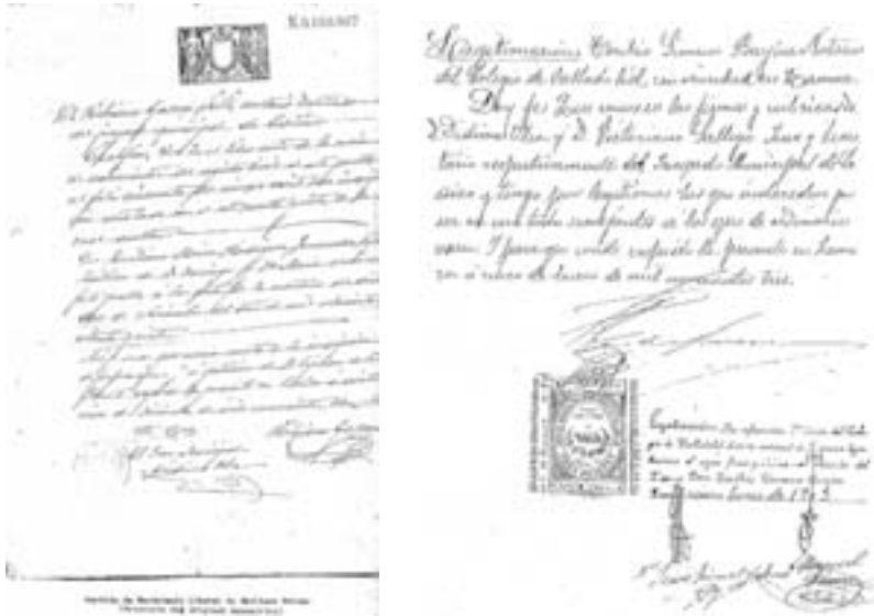
Partida de nacimiento literal de Emiliano Moisés (fotocopia del original manuscrito).

ta hasta 1948, cuando debe abandonar el mismo, por mandos del gobierno militar (no constitucional) que se lo impone, a pesar de lo cual, le reconoce en nota adjunta su gestión como “un ejemplo”.