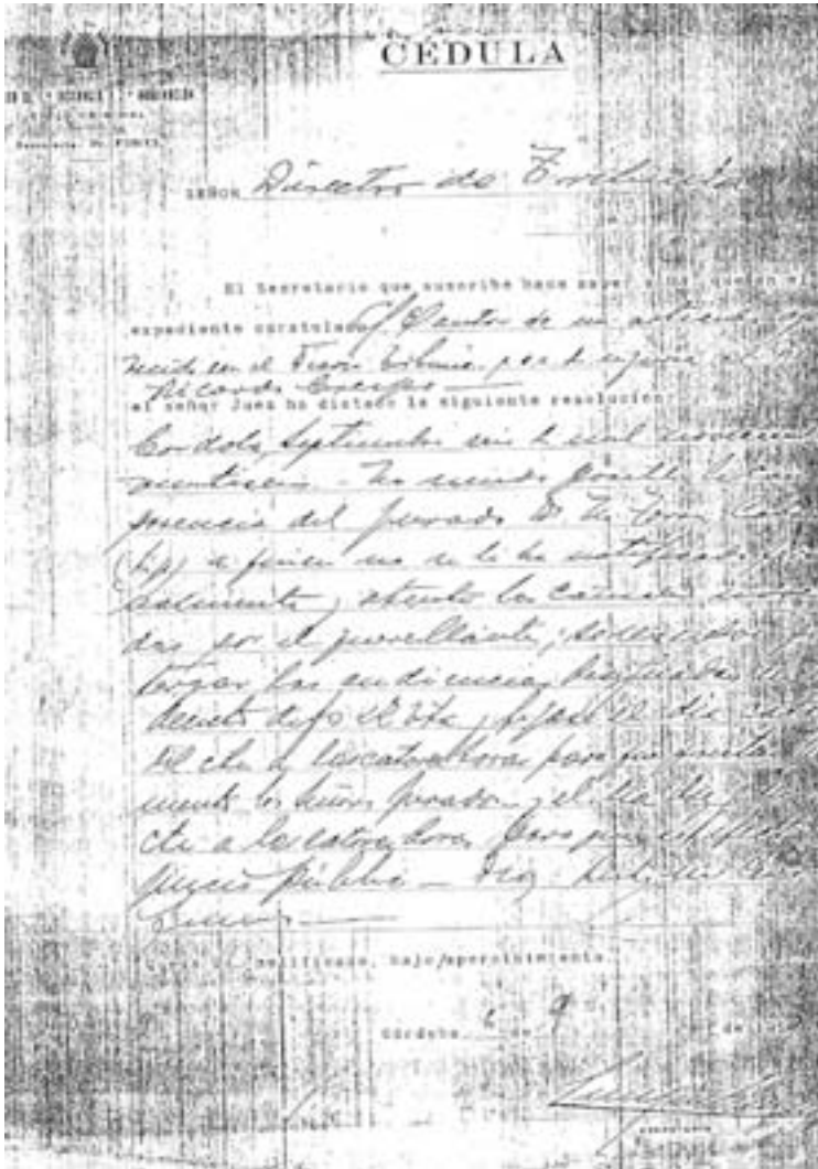
Cédula de citación del Juzgado de 1ª Instancia por la nota periodística aparecida en el periódico que dirigía en Córdoba, Argentina.