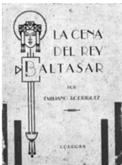
Portada del libro “La Cena del Rey Baltasar” obra de teatro escrita y publicada por Emiliano Moisés, representada por 1ª vez en el teatro “Rivera Indarte”, Córdoba-Argentina en 1934